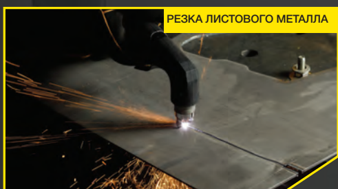
РЕЗКА ЛИСТОВОГО МЕТАЛЛА

Панель управления системы плазменной резки HandyPlasma имеет понятный интерфейс, цветной ЖК-экран с диагональю 2,8 дюйма, который четко отображает все настройки, которые необходимо видеть одновременно: режим резки, входное напряжение и входное давление воздуха.