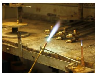
Пламя легко регулировать