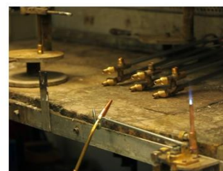
Автоматически гаснет, когда не используется