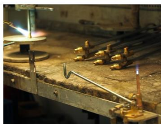
Небольшое пламя горит при работе