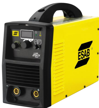
LHN 250i Plus